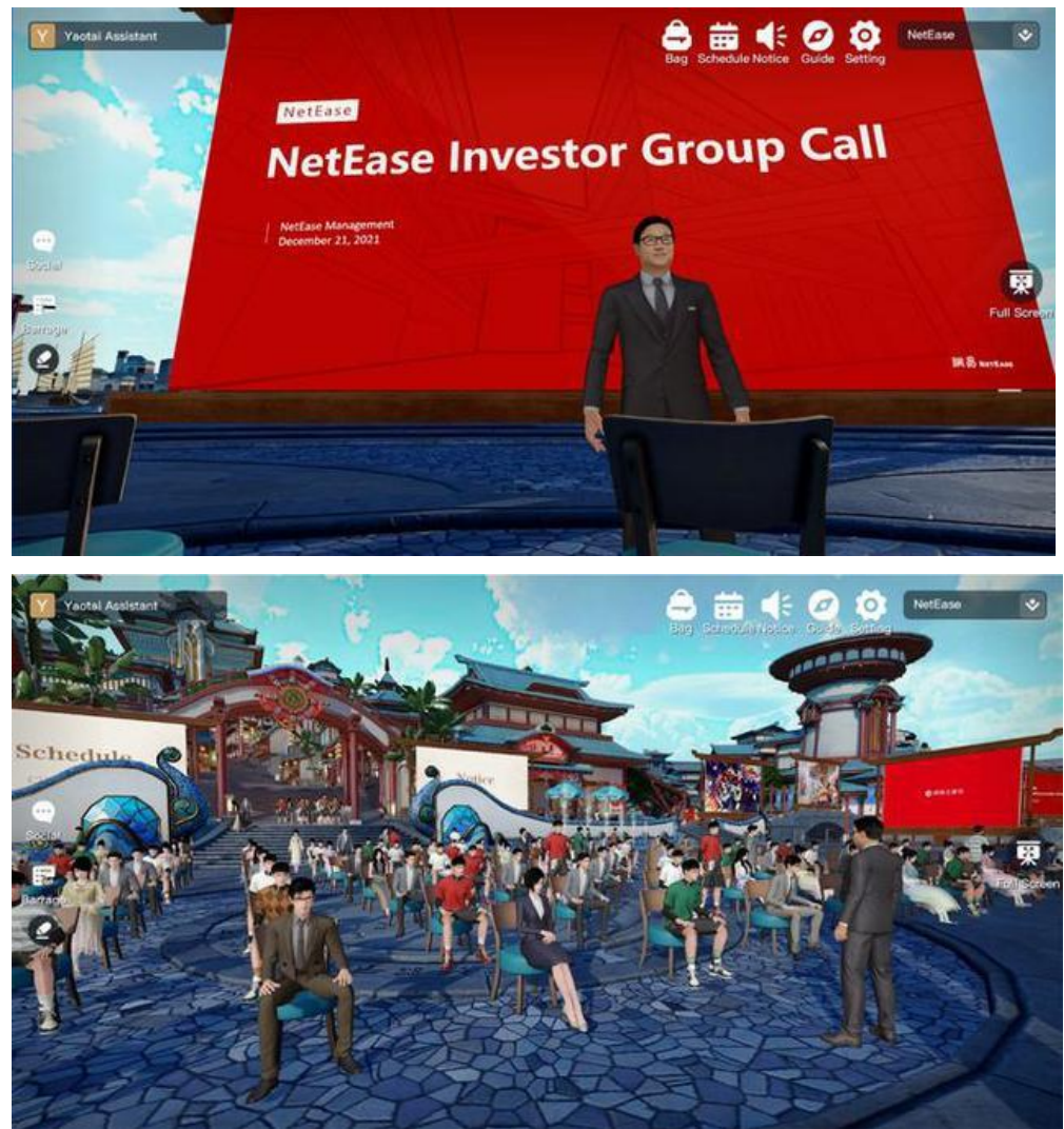
图 2：在沉浸式活动系统“瑶台”举办的投资者沟通会

易在国内首个“元宇宙”落地产品。这次会议中，参会人通过自己的虚拟形象参加，高管与投资人在全虚拟的环境中交流业务的最新动态，未来“瑶台”将会开放 UGC、PGC 等功能，为用户提供定制化的场景，让用户在其中能真实地表达个人的感情和实时互动，比如与朋友一起看球、蹦迪、看演唱会等等。另外会议上管理层也分享了 2022 年新游上线计划，其中包括：《暗黑破坏神：不朽》计划在 2022 年上半年国内国外同步上线，游戏已于 1 月初完成国内付费测试，有望成为全球爆款产品；《哈利波特：魔法觉醒》计划在 2022 年二季度于日本、欧美地区发行，基于该产品拥有全球知名 IP 和在国内目前良好的表现，未来在海外上线的表现值得期待；《指环王》手游计划于 2022 年上半年在港澳台、日韩地区上线；2022 年一季度计划上线“瑶台”的全球游戏开发者平台。同时未来还有足球、射击类产品储备在计划中，目前还在等待版号重新发放开启。